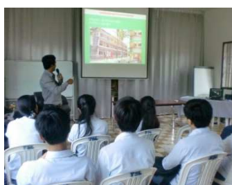
教育普及チームが地元の学生に平和講話をしている様子 カンボジアの若者はほとんど「ポル・ポト政権」のころの歴史を知らない。