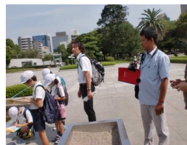
沖縄や広島で平和教育の手法を学ぶ