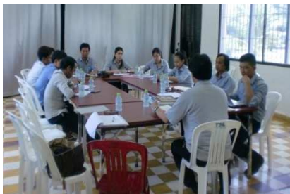
教育普及チームのとの意見交換

博物館職員(教育普及チーム)に対して「ワークノート」をより計画的、効果的に活用するための技能が育成されることにより、博物館における平和教育の多様な手法が確立される。